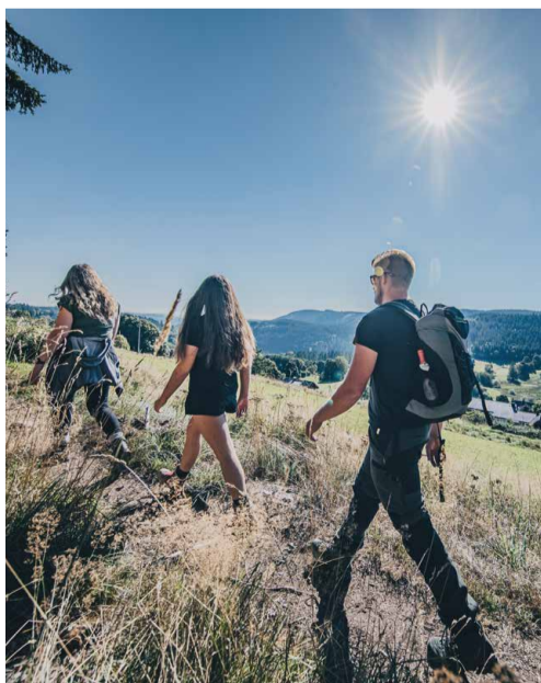
Nach dem Aufstieg ist vor der Brotzeit