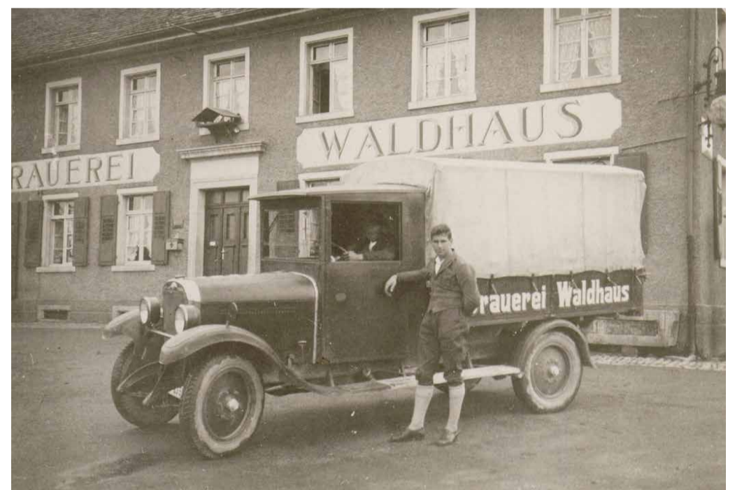
... über die ersten Lkw-Belieferungen in den fünfziger Jahren ...