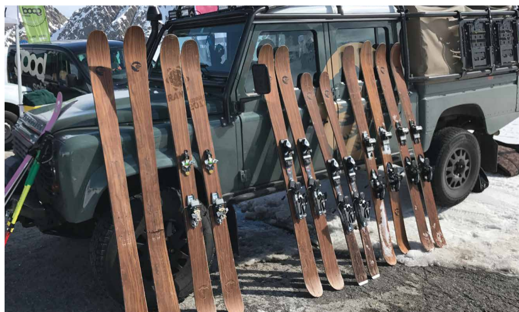
So schön schauen die Holzskier von Black Forest Skis aus