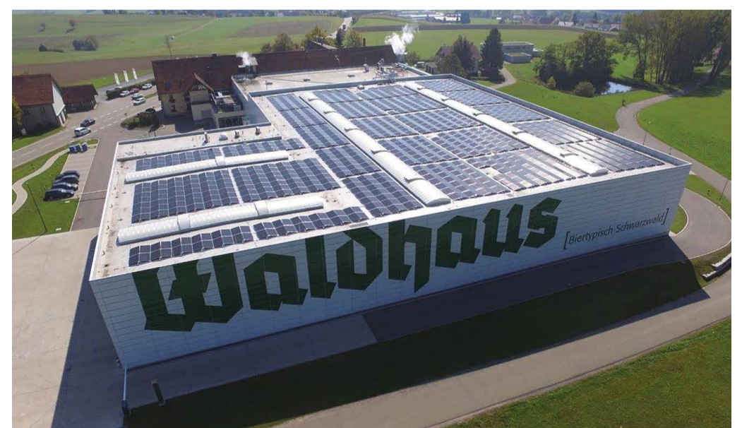
... bis zur eigenen hochmodernen Photovoltaikanlage