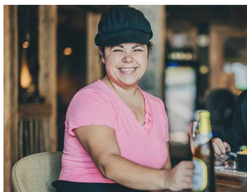
Ein Rezeptvorschlag von Tanja Giaramita

Die Riesengarnelen schneidet ihr zunächst etwas ein und entfernt den Darm. Dann werden sie roh eingelegt. Dafür braucht ihr Olivenöl, Chiliflocken, den Saft einer halben Zitrone, eine ausgepresste Knoblauchzehe und etwas Salz. Die Garnelen sollten vollständig