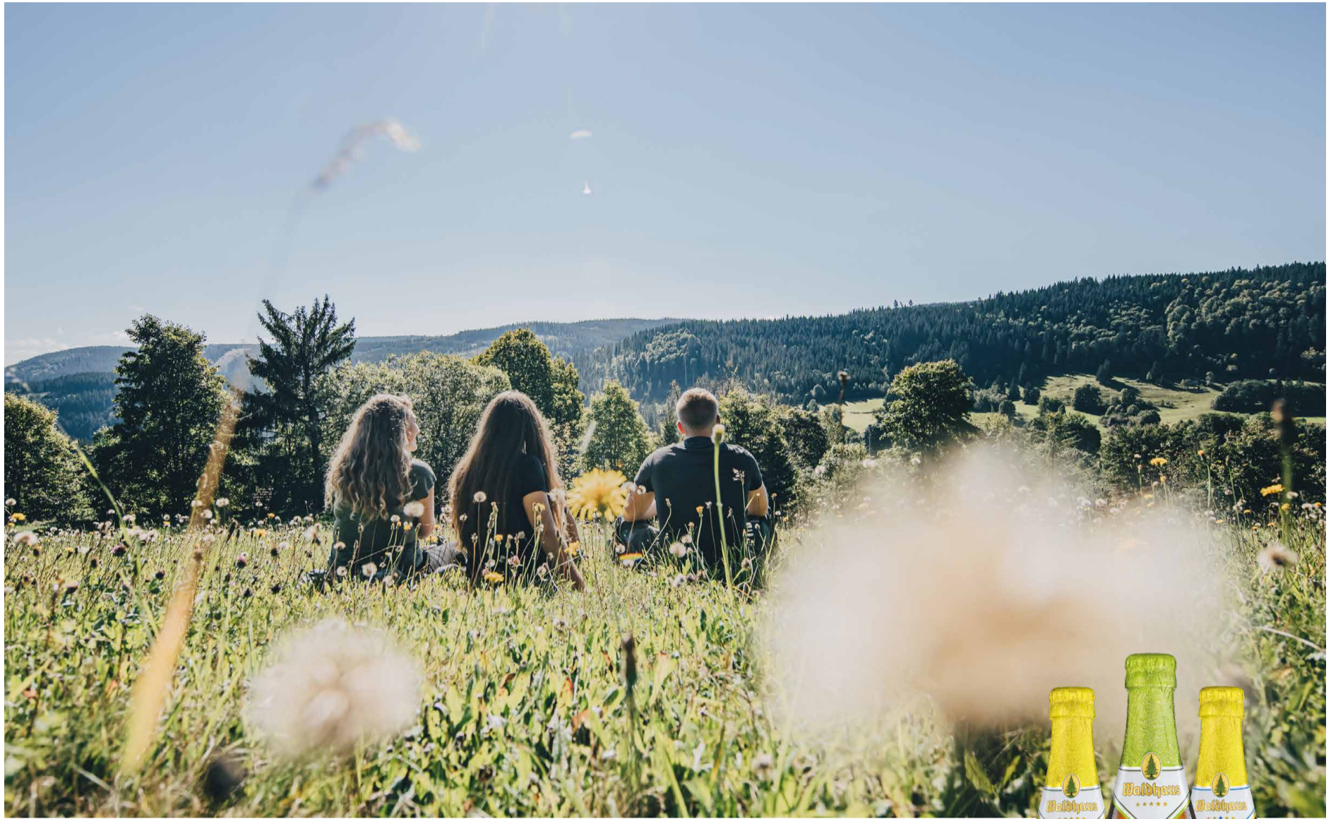
Ein Päuschen im Grünen

R und um den traditionsreichen Ort Raitenbuch verläuft der circa acht Kilometer lange „Hochschwarzwälder-Hirtenpfad“. Der Weg ist ein Denkmal für die „Schwarzwälder Hirtenbuben“. Noch bis weit ins 20. Jahrhundert hinein wanderten junge Hirten regelmäßig zu den Schwarzwaldhöfen. Dort hüteten sie die Viehherden – bei Wind und Wetter und unter großen Entbehrungen. Die Ältesten waren 14, die