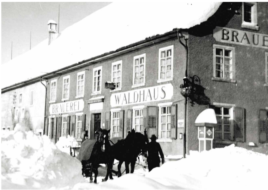
Von Pferdefuhrwerken und Kaltblütern ...